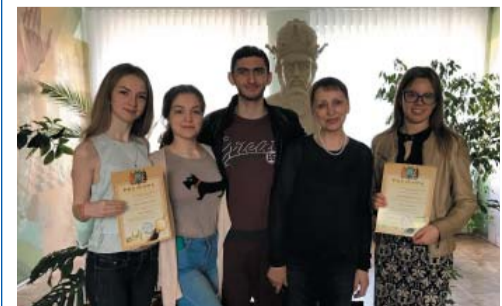
Переможці олімпіади у Львові

Колектив кафедри українознавства та латинської мови НФаУ