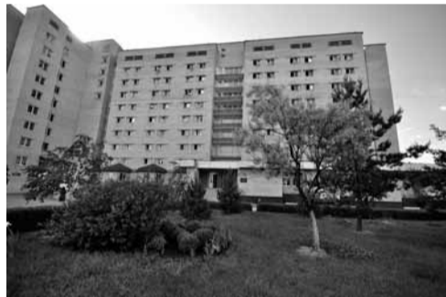
Гуртожитки №3 та 4