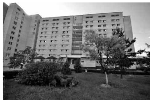
Гуртожитки №3 та 4