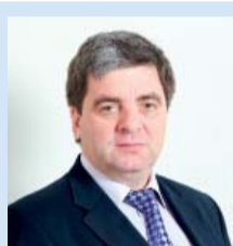
Сергій Борисович Попов, доктор медичних наук, професор, проректор з науково-педагогічної роботи (міжнародних зв'язків) НФАУ

На сьогоднішній день Національний фармацевтичний університет співпрацює з 77 ВНЗ та науковими установами з 37 країн Європи, Азії та Африки. Завдяки дружнім зв'язкам та партнерським відносинам НФАУ вже котрий рік поспіль успішно реалізує низку освітніх проектів за програмами академічних обмінів. Останнім здобутком Центру міжнародної профорієнтації та зовнішніх відносин НФАУ є участь науковців і студентів університету в програмі Європейського Союзу, що підтримує проекти, партнерства, заходи і мобільність у сфері освіти, підготовки, молоді та спорту — «Erasmus+». Для вишу країни, що не є членом Європейського Союзу, участі у таких програмах обмінів зазвичай передують копійки праці протягом кількох років. Прийшов час підводити перші підсумки.