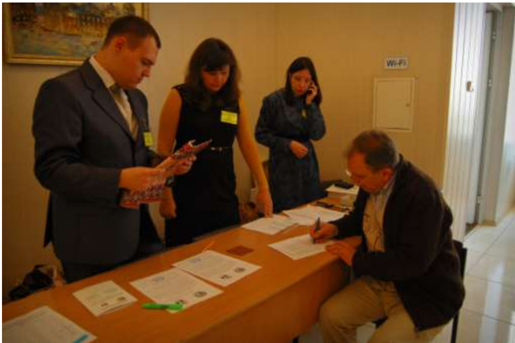
Реєстрація учасників конференції