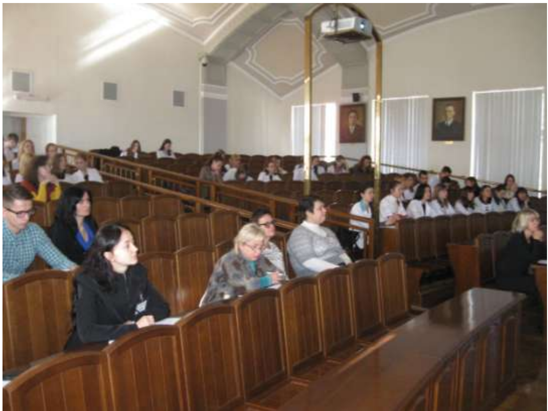
Аудиторія другого пленарного засідання