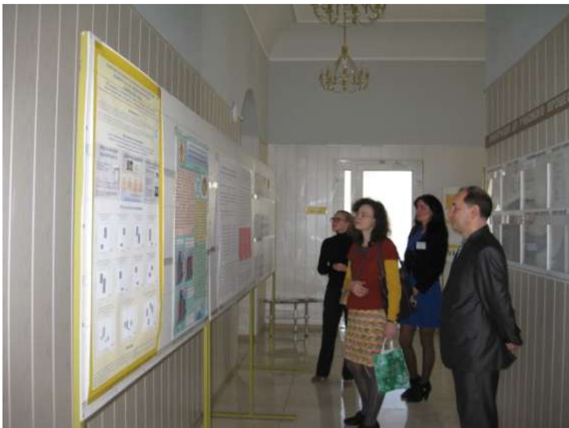
Знайомство учасників конференції з постерними доповідями