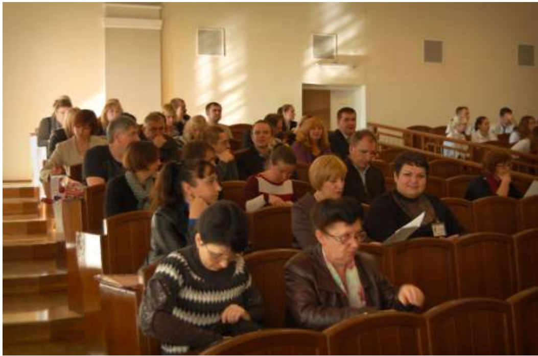
Учасники конференції (науковці, лікарі) та студенти НФаУ на першому пленарному засіданні