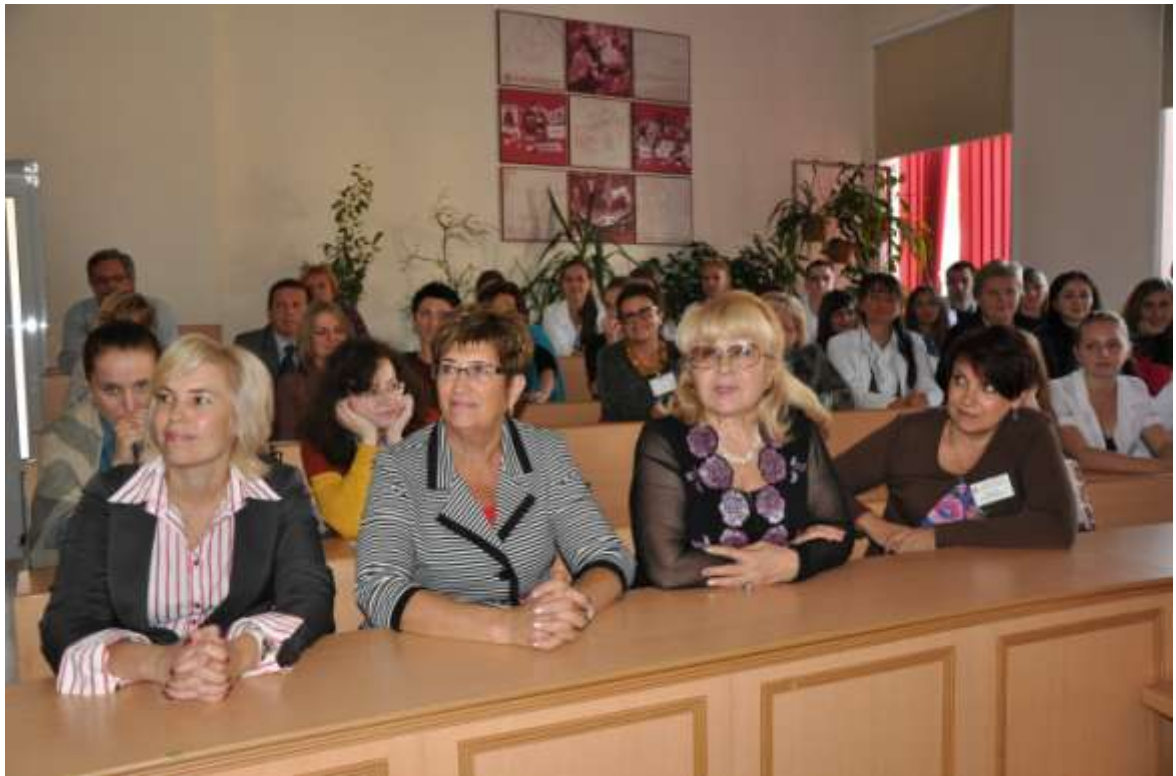
На засіданні школи молодих вчених