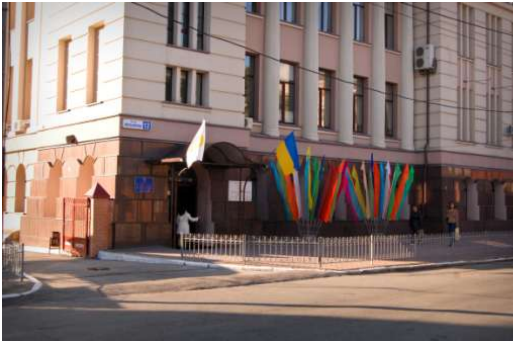
Медико-біологічний корпус НФаУ перед початком конференції