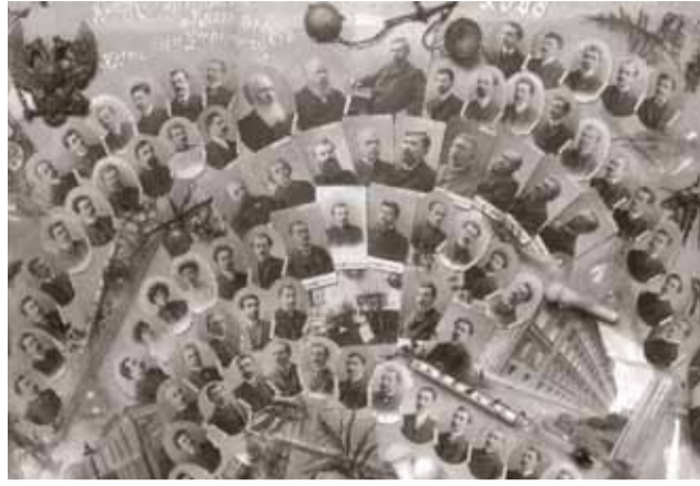
Выпуск провизоров, 1908