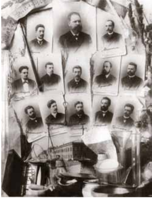
Преподаватели и студенты — фармацевты

В преддверии 210-летия фармацевтического образования в нашем городе любопытно обратиться к его истокам и понять, с чего же все начиналось. И сегодня мы начинаем рубрику, посвященную столь важному для фармацевтической общественности юбилею. В рамках рубрики Вы сможете узнать малоизвестные факты из истории фармации, ознакомиться с биографиями выдающихся ученых и организаторов фармацевтического дела, узнать, как строились университетские здания.