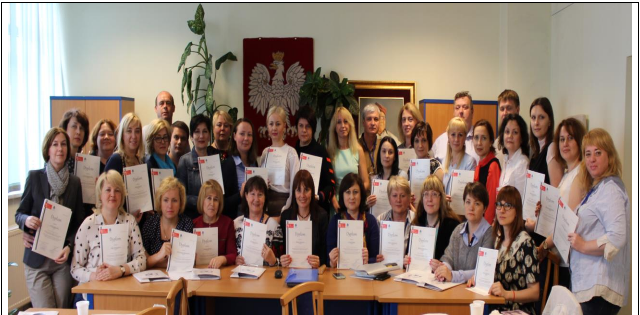
Учасники стажування для викладачів “Сучасний університет – проектний підхід до організації роботи згідно до положень європейських кваліфікаційних рамок” 10 – 16 травня 2015 р., м. Лодзь, Польща