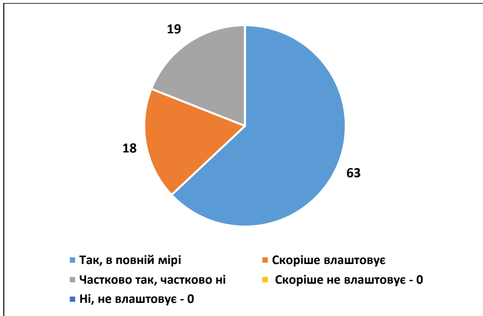
Рис. 2. Розподіл відповідей на питання «Чи влаштовує Вас процедура інформування про освітні компоненти, що пропонуються на вибір?», %

Здобувачі вищої освіти освітньої програми «Менеджмент» найчастіше оцінюють власне навчальне навантаження як помірне (рис. 3)